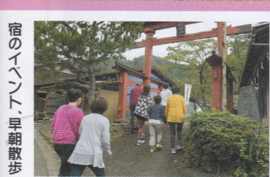
宿のイベント、早朝散歩