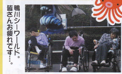
鴨川シーワールド。 皆さんお疲れです…。