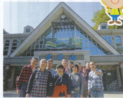
高尾山、ケーブルカー乗るぞ。