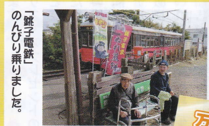
「跳子電鉄」 のんびり乗りました。