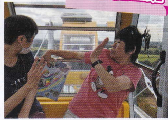
東武動物公園観覧車こわ〜い