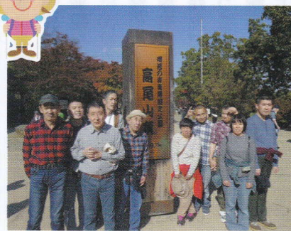
高尾山、頂上まで登ったよ！