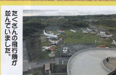
たくさんさんの飛行機が 並んでいました。