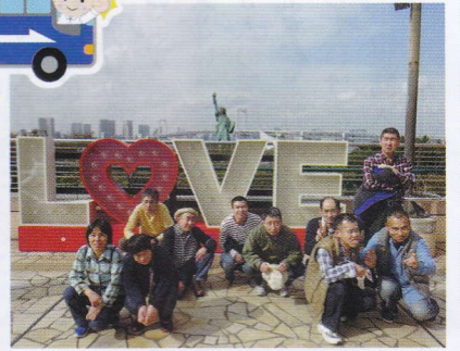
お台場海浜公園から愛を叫ぶ！