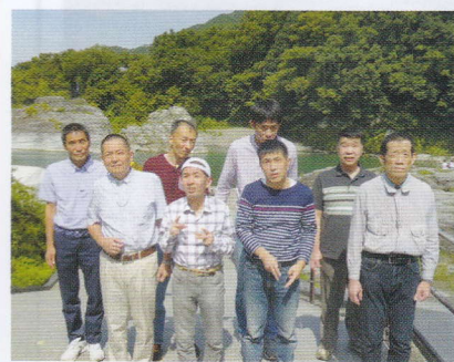
これから長瀬ライン下りです