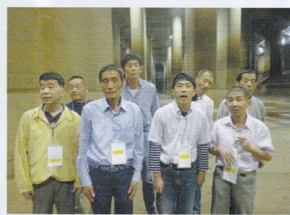
首都圏外郭放水路を見学しました。 「わ～でかい！」