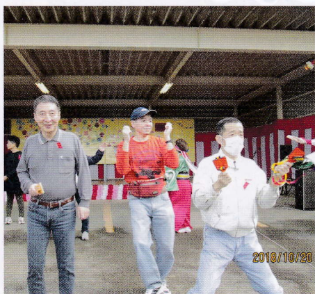
リズムにノッてるね♪