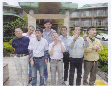
休暇村奥武蔵にて