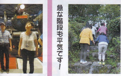
急な階段も平気です！