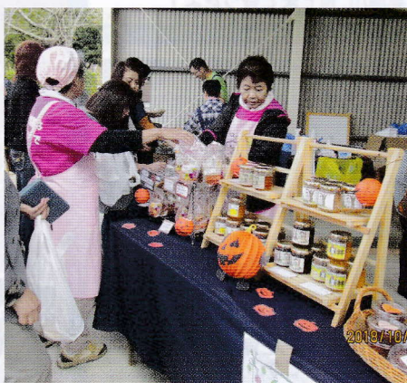
学園の目玉商品(ジャム)