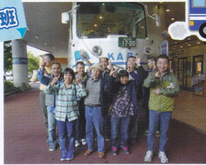
お台場がば号、出発進行！