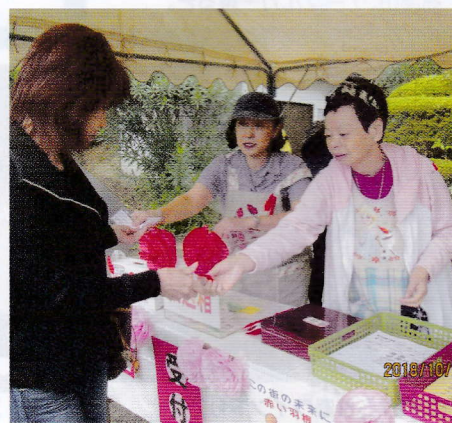
赤い羽根募金 “感謝”