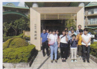
「奥武蔵」キレイな宿でした