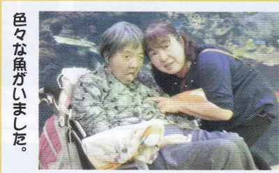
色々な魚がいました。